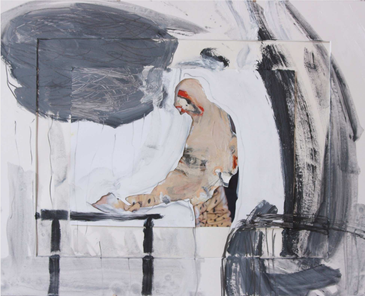
2 Zwiebschneiden 2, 2013, 40 x 50 cm 3 Er-inner-ung an Zwiebschneiden, 2013, 50 x 70 cm