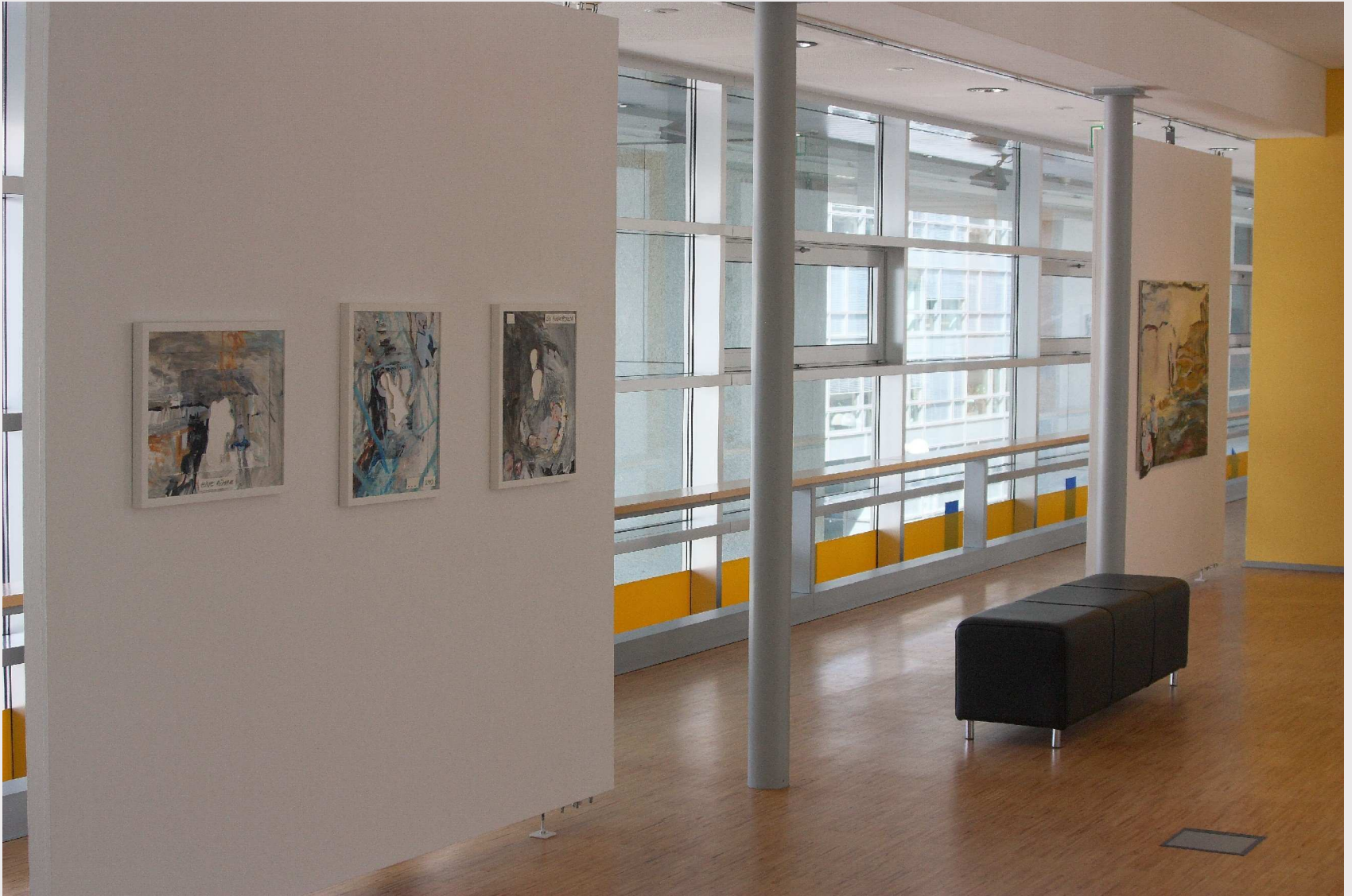
Ausstellungsansicht, "außer dem", Ausstellungsbrücke, St. Pölten, 2013