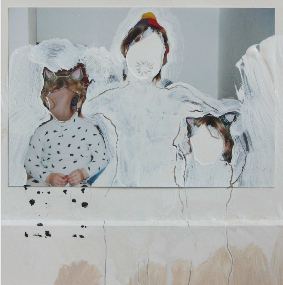
27 Fasching, 2012, 25 x 30 cm (Detail) 28 Fasching I, 2012, 30 x 25 cm (Detail)