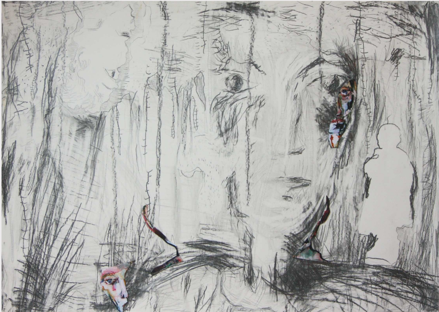
23 Er-inner-ung live with optimism II, 2013, 50 x 70 cm