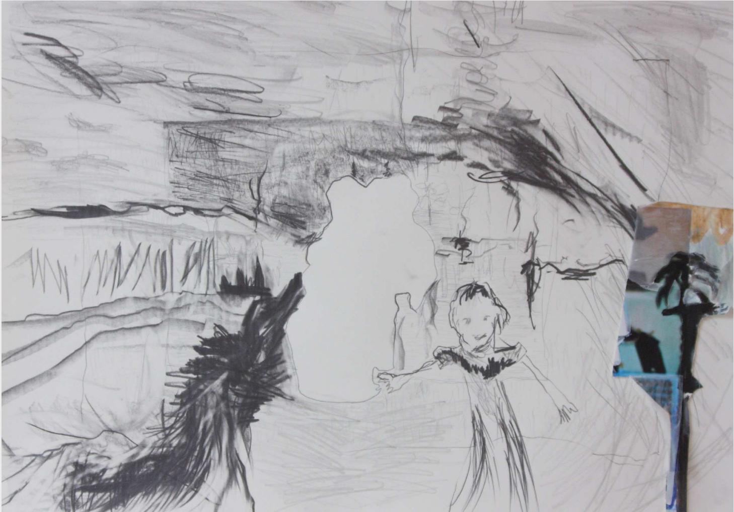
7 Er-inner-ung eine Röhre, 2013, 50 x 70 cm