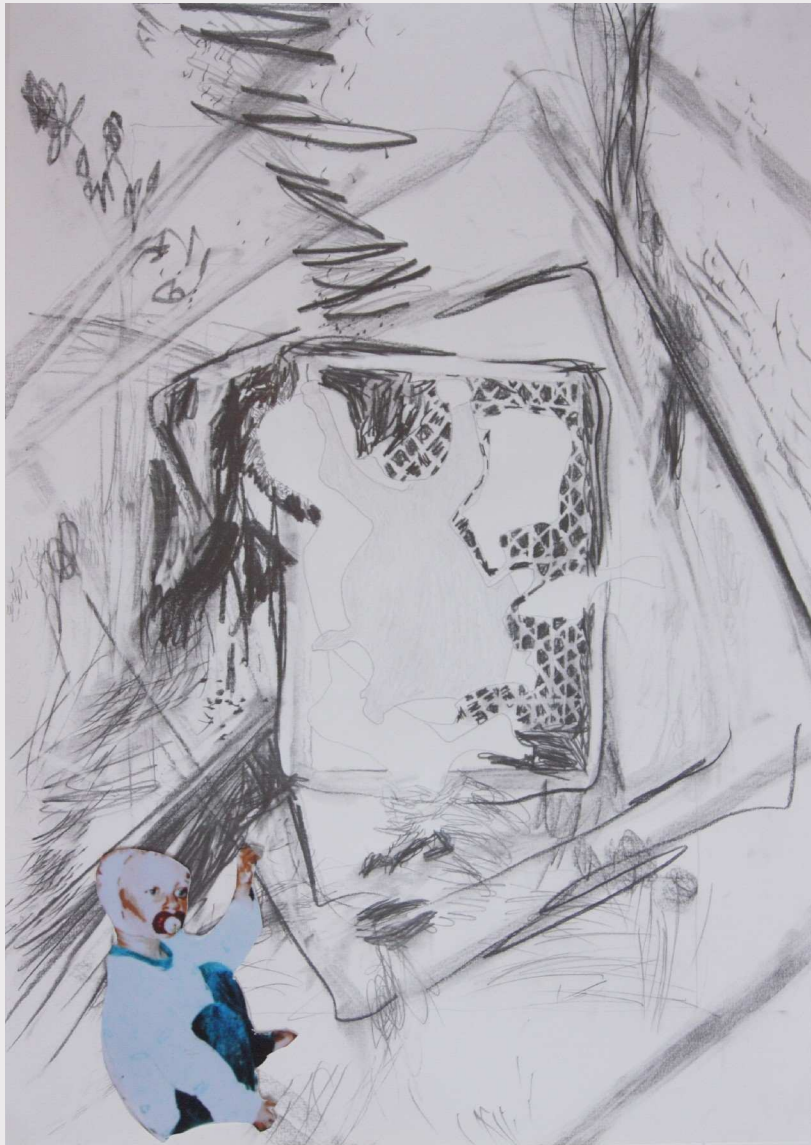
9 Er-inner-ung und, 2013, 50 x 70 cm