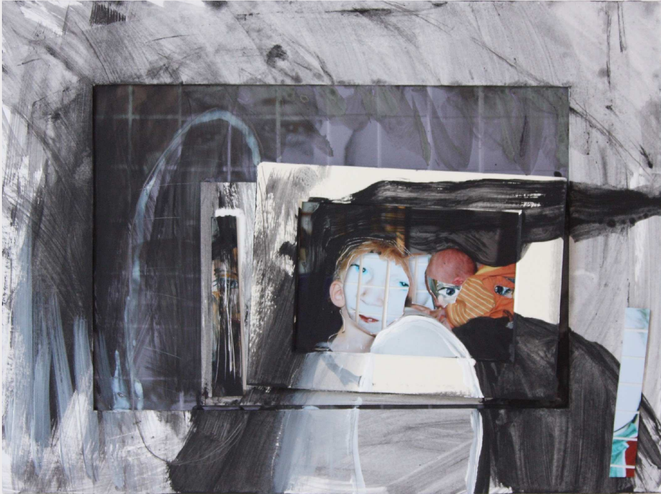
4 Er-inner-ung an Episode 2/I, 2013, 40 x 50 cm