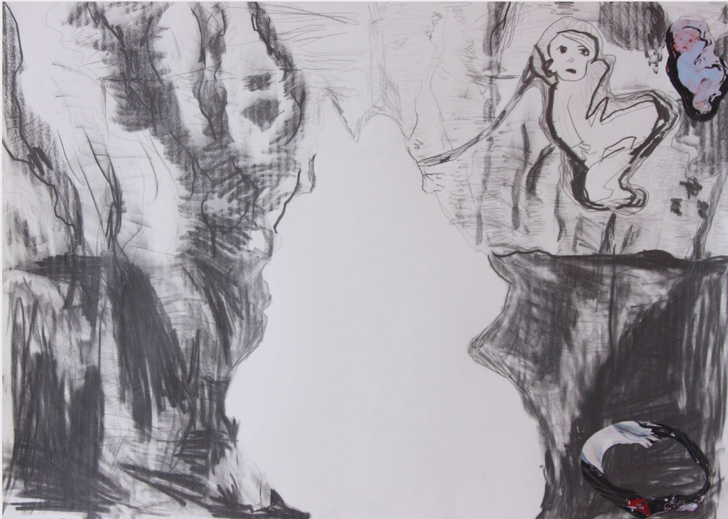
14 Er-inner-ung Abwesenheit, 2013, 50 x 70 cm