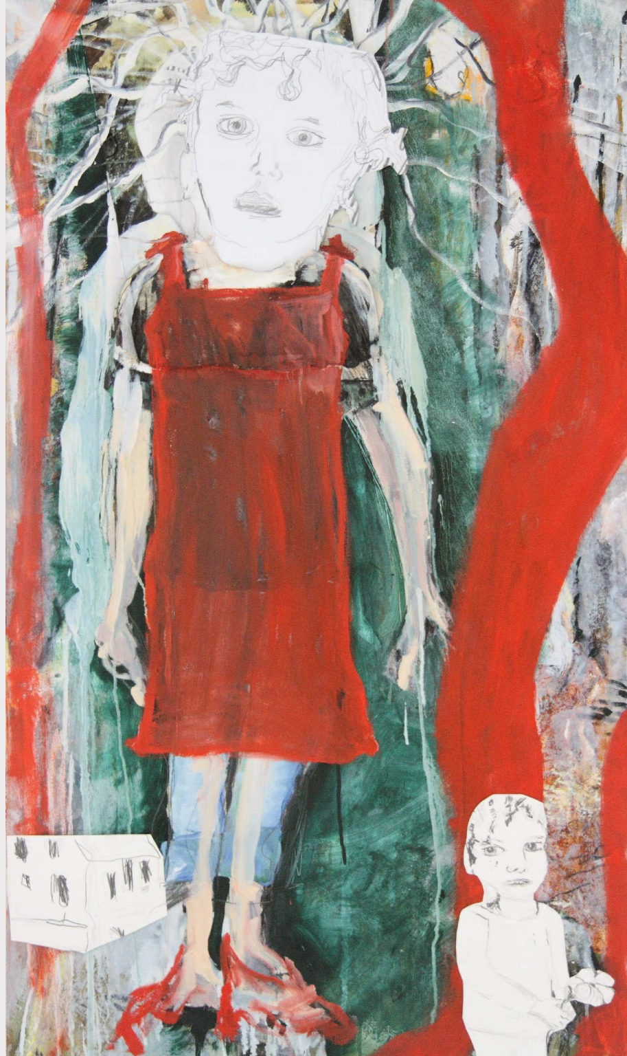
44 ohne Titel, Diptychon, 2012 120 x 70, 120 x 75 cm