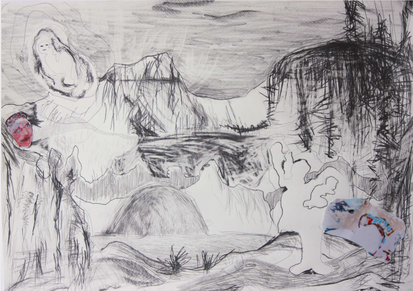
17 Er-inner-ung Treibgut I, 2013, 50 x 70 cm