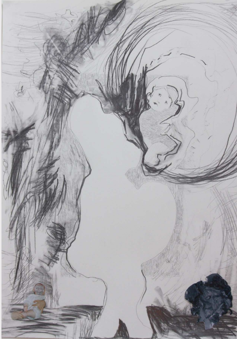
12 Er-inner-ung ein Traum, 2013, 50 x 70 cm